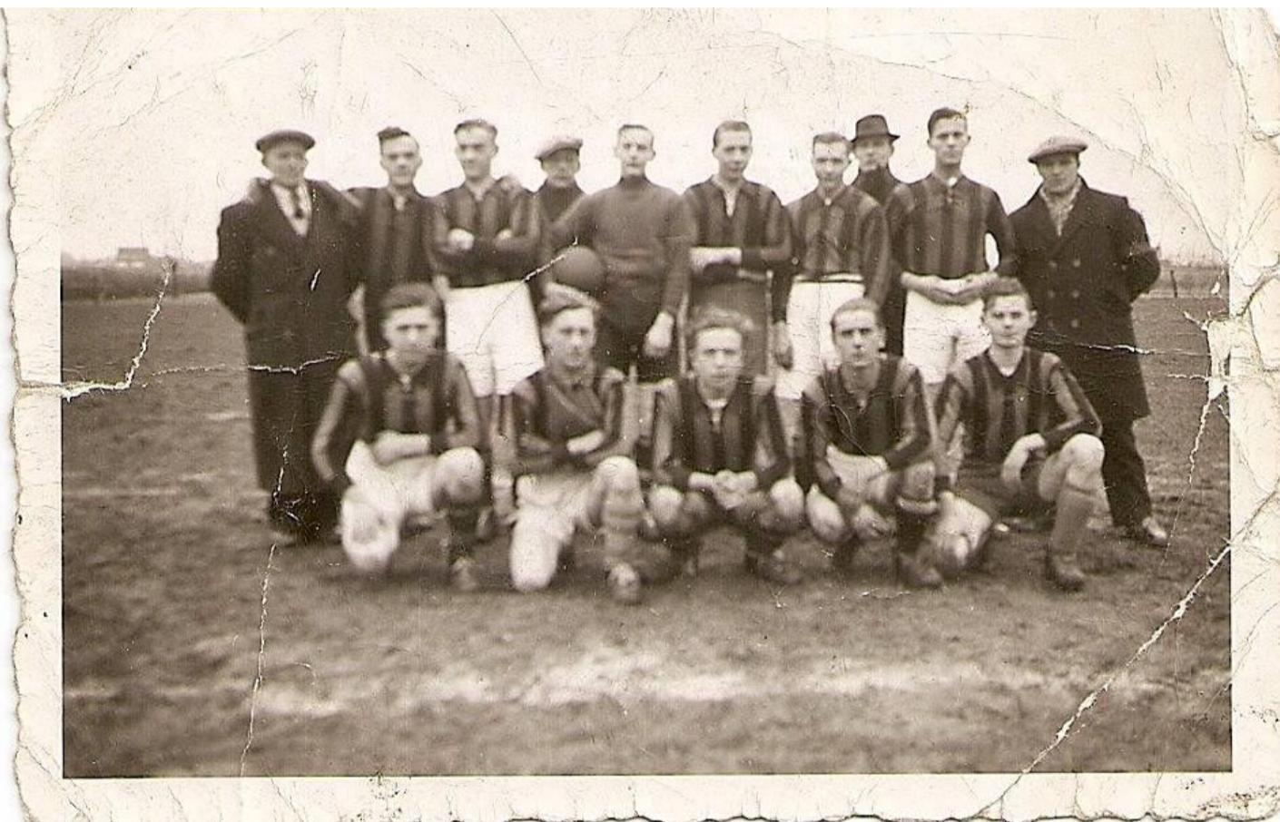
Hierboven een foto van de voetbalclub Hulste Sportief 1943-1944

Hij was het laatste slachtoffer uit Hulste tijdens de Tweede Wereldoorlog.