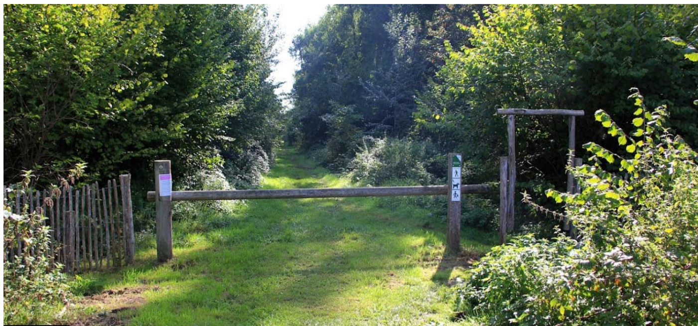
Ooigembos